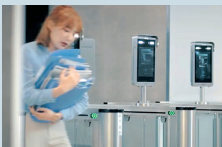
両手が塞がっていても大丈夫